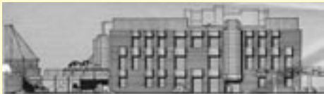
Dieser in "unsere Kirche" 1977 veröffentlichte Entwurf wurde niemals realisiert

Damit hielt das Thema Gesundheit auch immer