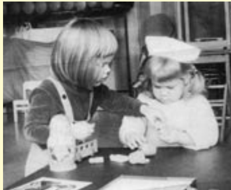
Besucherinnen der fabi in den 70er-Jahren

Am 26.05.1959 wurde der Verein "Ev. Mütterbildungswerk Münster" als Träger einer „Ev. Mütterschule“ gegründet. Die Satzung des damaligen Trägervereins beschrieb die Aufgaben wie folgt: Der Verein stellt sich die Aufgabe, Einrichtungen zu schaffen, in denen junge Mädchen und Frauen in der ihnen gemäßen Form Vorbereitung und Hilfe für ihr Wirken in Familie und näherer und weiterer Umwelt erhalten sollen. Alle Arbeit dieser Einrichtungen steht einheitlich unter dem Gedanken der Familienpflege. Die Erfüllung dieses Dienstes betrachtet der Verein als