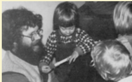
Väter in der Familienbildung spiegeln gesellschaftliche Veränderungen wider.

Erste Selbsterfahrungsgruppen und Kommunikations-Trainings sowie Selbsthilfe-Gruppen wurden angeboten.