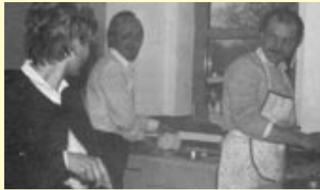
Gemeinsam lernen - bis heute gültig

mehr Einzug in die Familienbildung und unterstrich die immer stärker wachsende Einsicht in eine ganzheitlichere Betrachtungsweise von Familie.